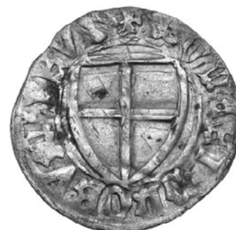
Rwers: tarcza zakonna, w otoku: +MONET, +DNORVM, ++PRVS

monety oznaczano literami: T-Toruń, M-Malbork, D-Gdańsk lub symbolami np. gwiazdka - Malbork, podwójny krzyż - Elbląg. Wyróżnia się aż 312 emisji różnych szelągów w czasie trwania Państwa Krzyżackiego.