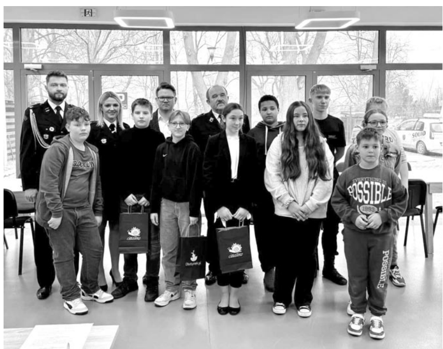
fol. UM Olsztynnek