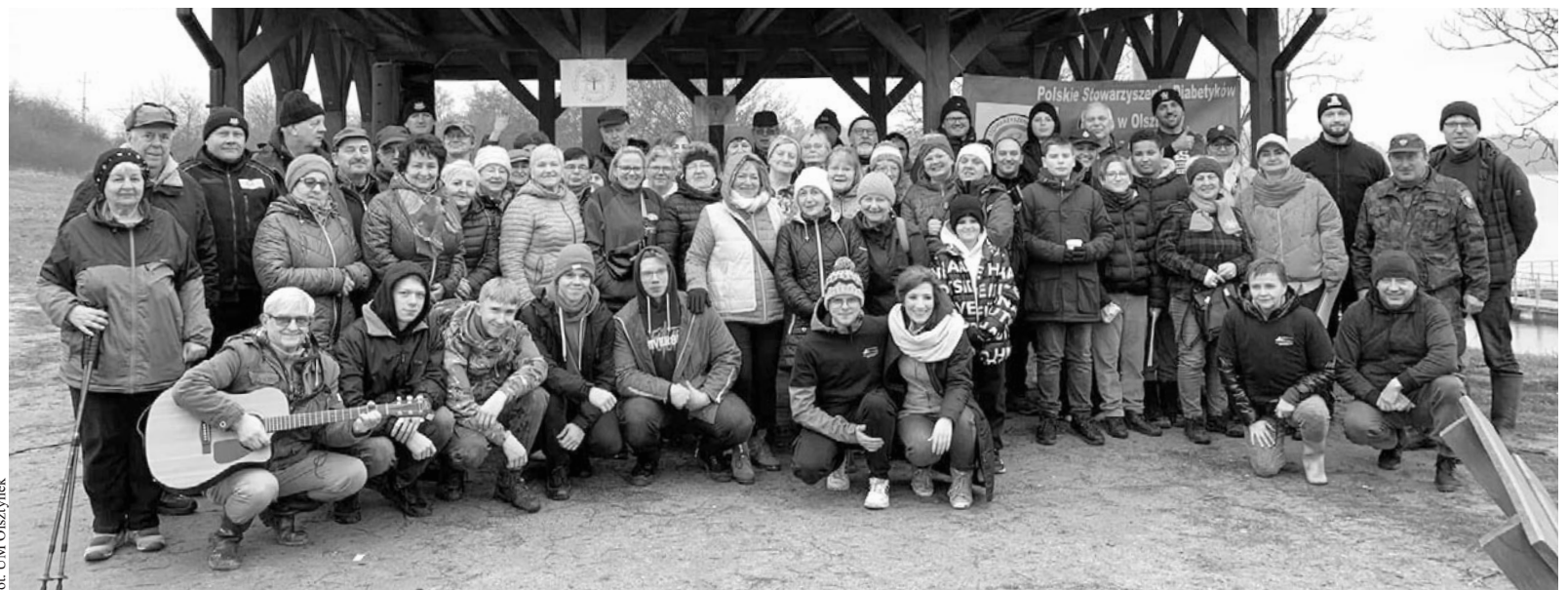
for. UM Olsztynek