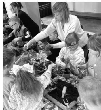
fol. UM Olsztynek