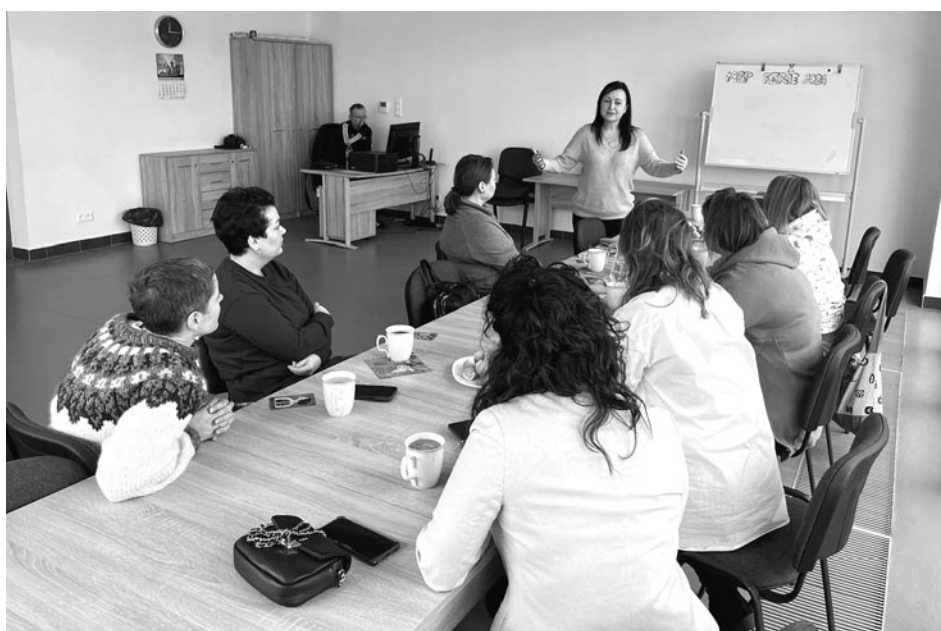
fol. Fundacja Candelaria

się duchem przewodnim dla uczestniczek projektu, które wraz z nim podjęły swoją podróż ku realizacji własnych marzeń. Przez trzy miesiące, od stycznia do marca, uczestniczki miały okazję brać udział w różnorodnych spotkaniach i warsztatach organizowanych w Zabytkowej Wieży Ciśnień w Olsztynku. Zajęcia prowadzone były przez doradców zawodowych, coachów oraz mentorów z dziedziny marketingu i kreatywności. Miały one na celu pomóc kobietom w odnalezieniu swoich pasji, określeniu kompetencji, a także stworzeniu planu działania. W ramach tych zajęć odświeżano lub stworzono nowe CV oraz poznawano aktualne możliwości dofinansowań. Dodatkowo, uczestniczki wzięły udział w warsztatach dotyczących prawidłowego oddychania, radzenia sobie ze stresem oraz sztuką wizażu i budo-