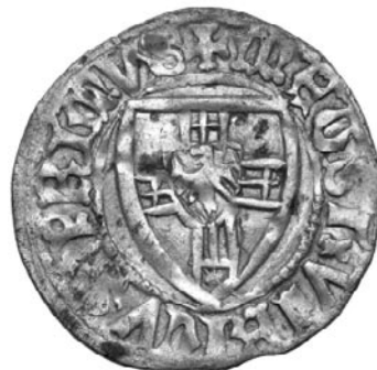
Awers: tarcza wielkiego mistrza, w otoku: +MAGST, +VLRICVS, ++PRIMVS

Najprawdopodobniej za rządów braci Jungingen bito je również w mennicy w Elblągu. Miejsce bicia