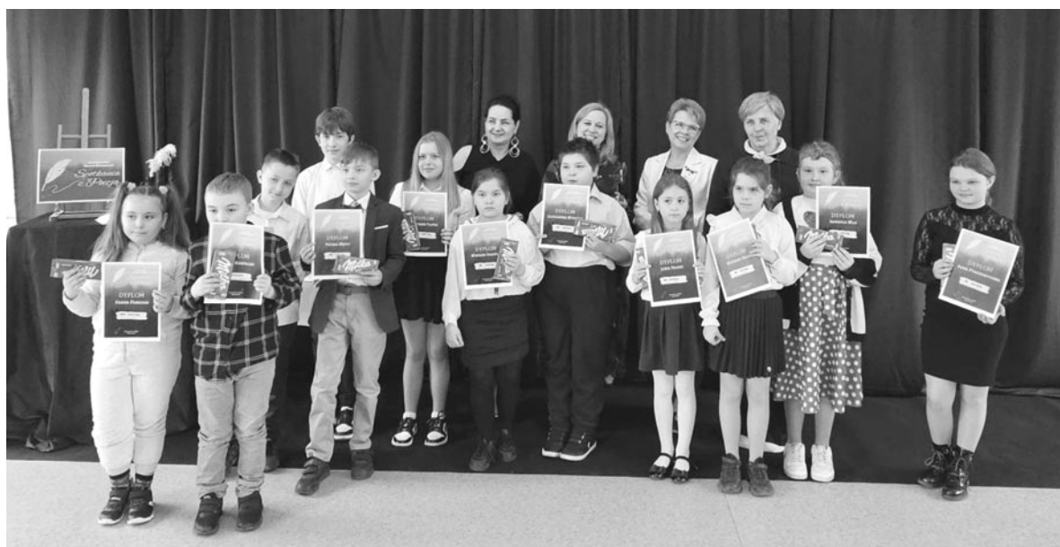
Uczestnicy eliminacji „XL Wojewódzkiego Konkursu Recytatorskiego – Spotkania z Poezją”