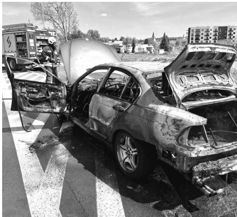
Ul. Olsztyńska. Pożar samochodu osobowego

► We wtorek, 26.03. na krajowej siódemce w okolicach Olsztyńka policjanci z Wydziału Ruchu Drogowego KMP w Olsztynie zatrzymali do kontroli kierującego scanią. W trakcie legitymowania mężczyzny okazało się, że jest on poszukiwany do odbycia kary 1,5 roku pozbawienia wolności za przestęp-