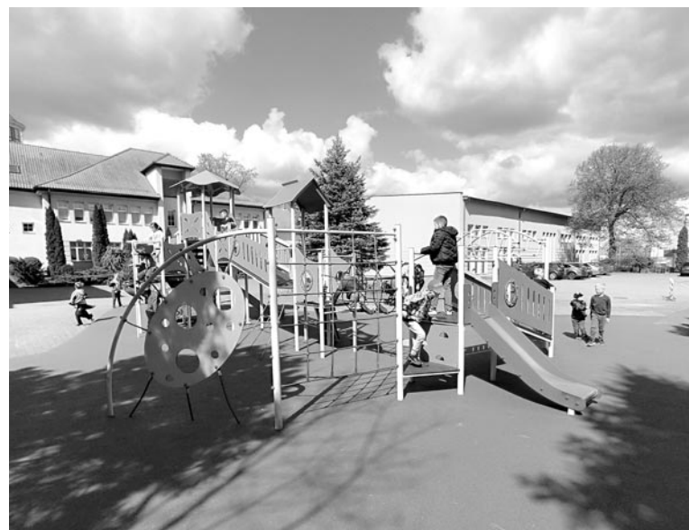
fol. SP nr 1 im. Noblistów Polskich Olsztynku