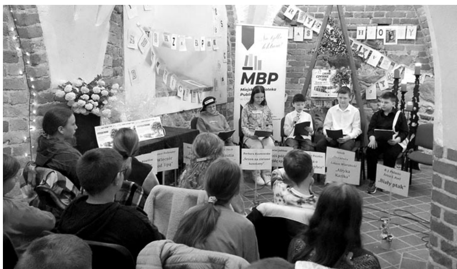
III Gminne Czytanie Pod Lipą

Z inicjatywy naszej biblioteki, przy współpracy z bibliotekami szkolnymi, powstała akcja czytelnicza, która na dobre wpisała się w kalendarium wydarzeń MBP w Olsztyńku. „Jak twierdzą eksperci z zakresu psychologii i pedagogiki, głośne czytanie jest prostym, tanim i skutecznym sposobem