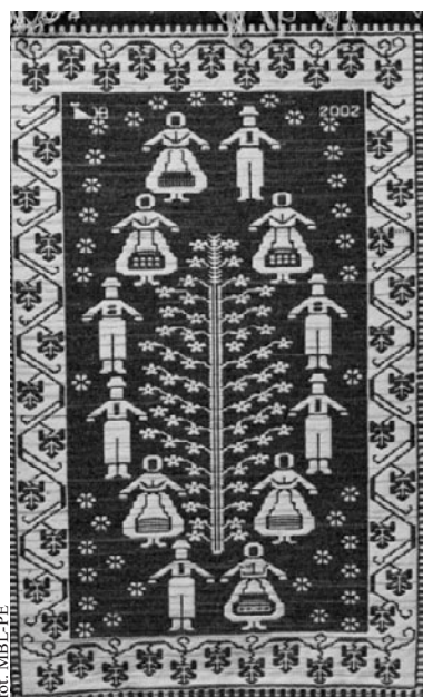
Tkanina „W cieniu drzewka”