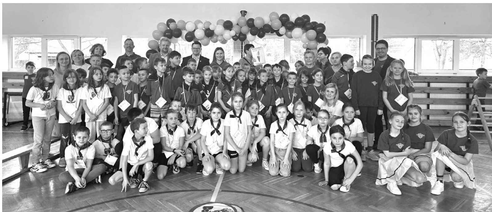
for. Szkoła Podstawowa im. Jana Pawła II w Waplewie