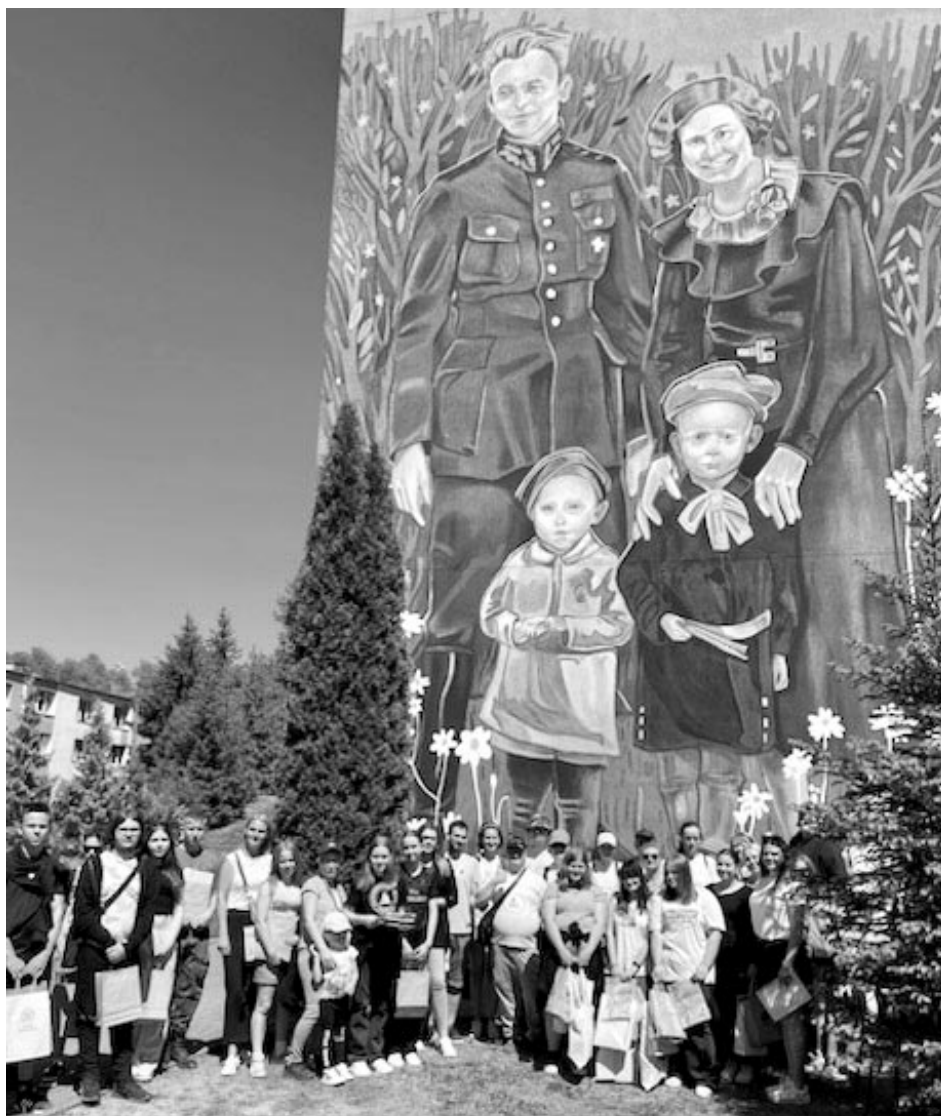
Uczestnicy gry na tle muralu zdobiącego mury szkoły

Fabula gry powstała na kanwie życiorysu rotmistrza, jego działań i zamiłowań. Wydarzenie współorganizował Instytut Pamięci Narodowej Delegatura w Olsztynie. Z zaangażowaniem współpracowały z nami jednostki organizacyjne gminy - Urząd Miejski w Olsztynku, Nadleśnictwo Olsztynek, instytucje: Ochotnicza Straż Pożarna w Olsztynku, Miejska Biblioteka Publiczna w Olsztynku, Muzeum Budownictwa Ludowego - Park Etnograficzny w Olsztynku, Multimedialne Muzeum Obozu Jenieckiego Stalag IB i Historii Olsztynka oraz placówki: Zespół Szkół im. Krzysztofa Celestyna Mrongowiusza w Olsztynku, Warsztaty Te-