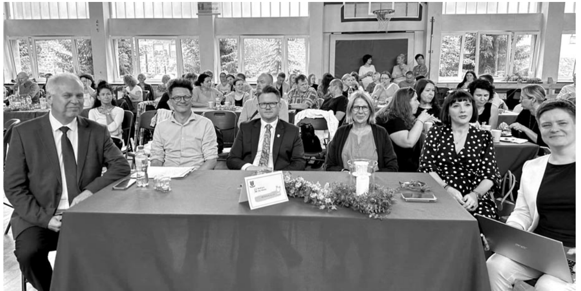
Konferencja odbyła się w przyjaznej i inspirującej atmosferze

„Budząca się Szkoła” to inicjatywa, której celem jest propagowanie kultury uczenia się opartej na rozwoju potencjału uczniów, nauczycieli i szkół. To dzięki akcjom przez nich wymyślonym i rozpowszechnianym coraz więcej dobrego dzieje się w polskich szkołach. To inspiracja do zmian, których celem jest odejście od pruskiego modelu szkoły – bez rewolucji, małymi krokami, które podejmują same szkoły – nauczyciele, uczniowie i rodzice. Na początek może być to pozbycie się dzwonka, zamiast jedynek – jnt (jeszcze nie teraz) lub sjr (spróbuj jeszcze raz), informacja zwrotna, metoda zielonego długopisu, aż po odejście od ocen cyfrowych –