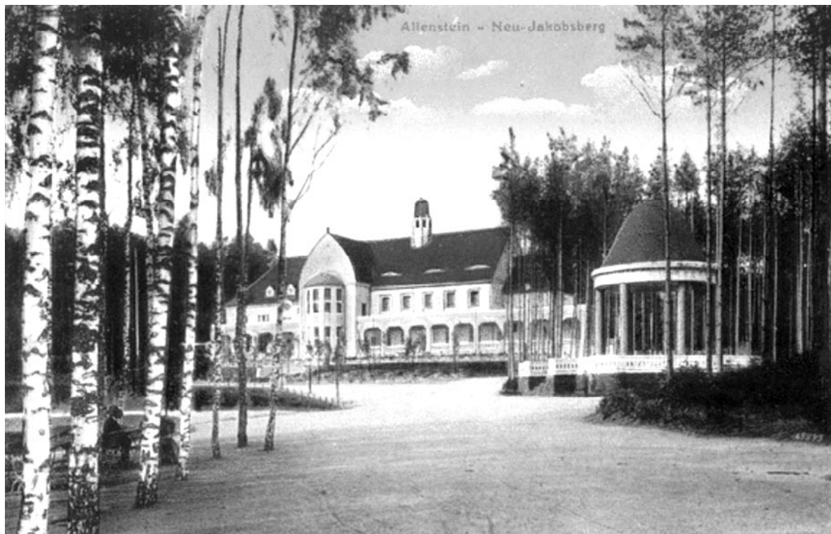
Restauracja Neu Jakobsberg - dzisiaj, Centrum Edukacji i Inicjatyw Kulturalnych