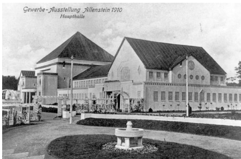
Jeden z budynków wystawy przemysłowej z 1910 r. - dzisiaj pozostała jedynie fontanna