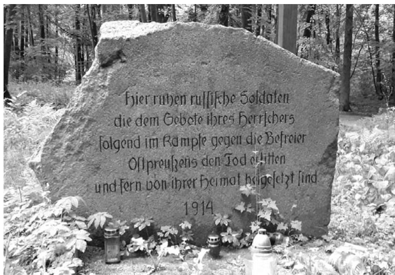
Granitowy głaz na jednym z cmentarzy wojennych w Jakubowie

Cmentarz został poświęcony w marcu 1915 r., jednak pierwsze pochówki żołnierzy niemieckich poległych pod Olsztynem odbyły się już w sierpniu 1914 - pochowano tu pierwszych 7 żołnierzy armii niemieckiej, poległych w walkach w Olsztynie. Pozostali to polegli na innych frontach lub zmarli w miejscowym lazarecie. W czasie I wojny światowej pochowano na nim 87 żołnierzy. W okresie międzywojennym chowano tu także osoby cywilne, a w czasie II wojny światowej znowu żołnierzy. Łącznie spoczywa tu około 800 żołnierzy z obydwu wojen światowych. Po wojnie cmentarz uległ dewastacji. Odrestaurowany został w 1992 r. z inicjatywy przewodniczącego Związku Mniejszości Niemieckiej w Olsztynie. Drugi z cmentarzy na olsztyńskim Jakubowie usytuowany jest po wschodniej stronie szosy do Dobrego Miasta (prawie naprzeciwko cmentarza wojskowego), ►