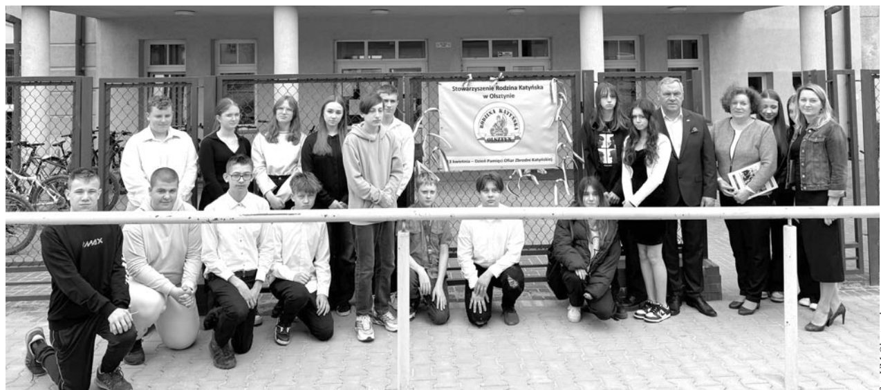
fol. UM Olsztynek

Młodzież klas VII i VIII uczestniczyła w warsztatach „Śledztwo Katyńskie” prowadzonych przez edukatorów z Delegatury Instytutu Pamięci Narodowej w Olsztynie. Odbłyły się one w olsztyńskiej Wieży Ciś-