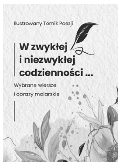
Okladka Ilustrowanego Tomiku Poezji

A jednak marzenia się spełniły i z dumą ogłaszamy, że ukazał się Ilustrowany Tomik Poezji „W zwykłej i niezwykłej codzienności...”. Jest to pierwsza tego typu publikacja promująca utalentowanych poetów i malarzy z terenu gminy Olsztynek, która zrodziła się z pragnień grupy osób silnych duchem. Pomysł tego wydawnictwa przez wiele lat drzemał i dojrzewał też w mojej wyobraźni, a zakiełkował na poranku poetyckim 15.11.2022 roku. Po kolejnym spotkaniu literackim 18.04.2023 r. podmiotem, który instytucjonalnie zdecydował się zmaterializować marzenia ludzi z pasją był Zarząd Stowarzyszenia Aktywna Gmina. Statutowa działalność stowarzyszenia stara się wypełniać niszowe zapotrzebowania w lokalnej społeczności. A taką aktywnością jest amatorska twórczość literacka lokalnych poetów i malarska olsztyneckich malarzy. Osoby te są bardzo wrażliwe na zawile niuanse codzienności, jak również na wszechobecne piękno otaczającego nas świata. Talent, systematyczna praca z pasją tworzenia, połączone z artystyczną wyobraźnią sprawiają, że amatorskie prace niewiele ustępują profesjonalnym dziełom. W tomiku znalazły też swoje, poczesne miejsce utwory i prace wybitnych poetów i malarzy związanych z gminą Olsztynek, których twórczość uznana jest w kraju i za