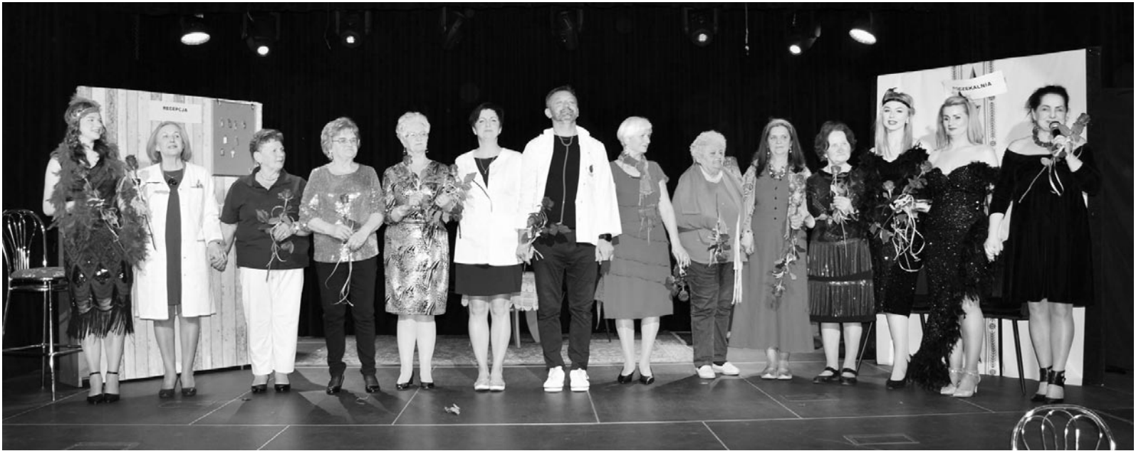
Spektakl „Słowne igraszki M. Czubaszki” swoją odsłonę miał również w Stawigudzie